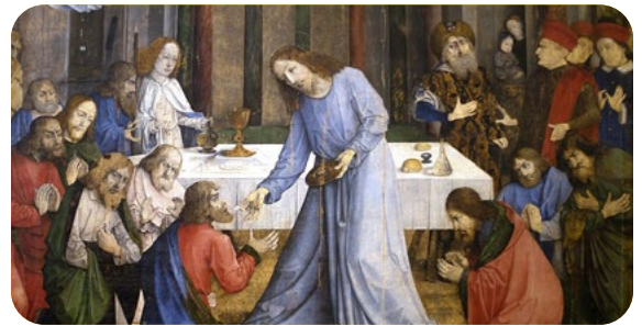
2. La Presencia Real y el culto eucarístico