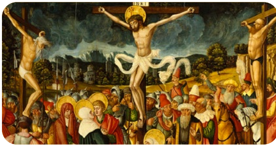
1. El Misterio Pascual y la Eucaristía

Durante este Año del Avivamiento Parroquial, animamos a los párrocos a poner en práctica una serie de homilias dominicales dedicadas exclusivamente a la Eucaristía. El culto eucarístico y las implicaciones de este culto son vitales para toda nuestra vida. Estas homilias podrían abarcar